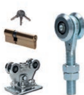
Příslušenství pro brány