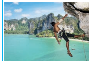
Horolezectví v Krabi, Thajsko

Jestli nejste typ turisty, co by se dokázal celé dny jen slunit na pláži, pak pro vás dobrou zprávou bude, že se právě nacházíte v ráji všech potápěčů. Vyhlášenou lokalitou, kde se můžete ponořit do hlubin a pozorovat korály a mořské živočichy je ostrov Koh Lanta Yai. Má zhruba 20 km čtverečních a najdete zde mnoho menších pláží, kde zdaleka není tolik turistů.